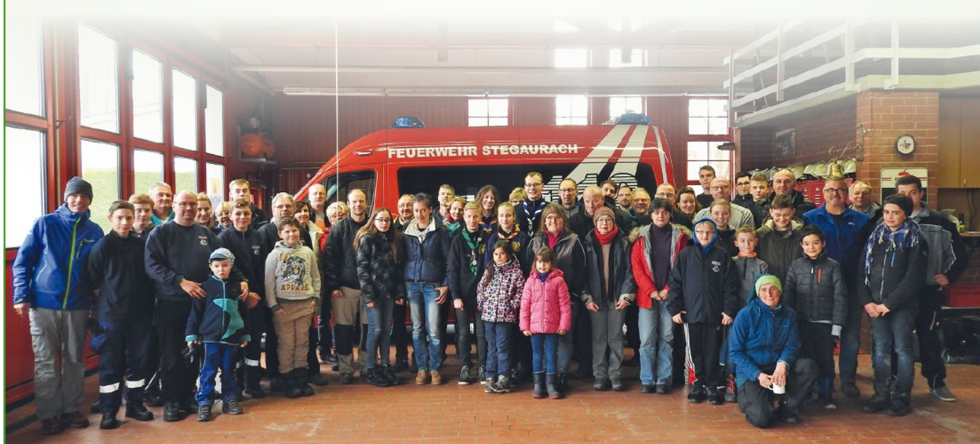
Thilo Wagner 1. Bürgermeister